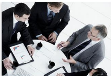
Engage in business

Library Providing market entry resources for Greek companies with a rich library of 25.000 market reports