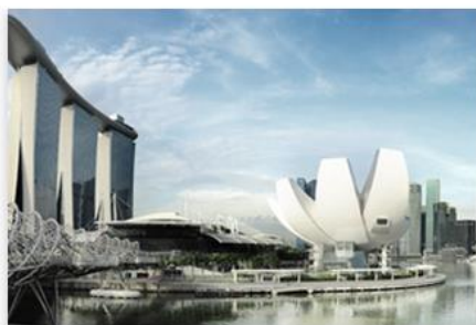
Explore new markets

MORE THAN 200.000 IMPORTERS TO EXPAND YOUR BUSINESS OVERSEAS