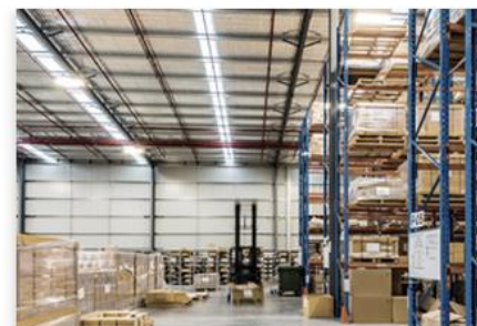
Manage trade operations

Club An innovative business network platform exclusively dedicated to our Greek and Cypriot clients